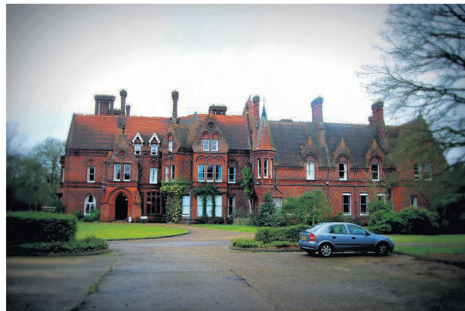
Uit heel de wereld komen christenen naar Bijbelschool All Nations in het Engelse Ware, vlak boven Londen, om zich voor te bereiden op zendingswerk. De culturele verschillen tussen studenten zorgen voor een unieke leerervaring.

Gevestigde media moeten niet denken dat zij van het verschijnsel nepnieuws zijn vrijgesteld. De afgelopen decennia moesten de Volkskrant en Trouw diep door het stof vanwege journalisten die hun zeer dikke duim hadden gebruikt. Tja, nepjournalistiek is een monster in vele gedaantes. Nog even en je kunt ook columnisten niet meer vertrouwen.